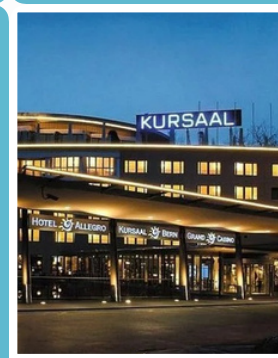
Kursaal Bern 150 Gäste